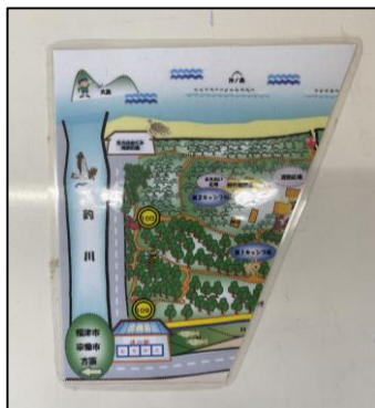
宝箱の地図(左半分)