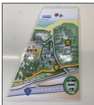
宝箱の地図(右半分)