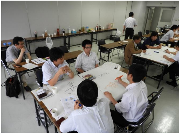
〈グループ協議の様子〉