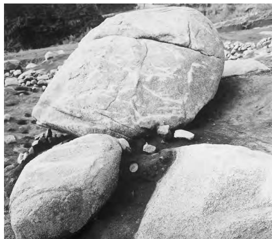
おごうち さいし 五ヶ山東小河内遺跡 1号祭祀遺構

おごうち 東小河内集落の中心地の下方に位置し、13～14世紀には柵で囲まれた区画があり、15～16世紀になると石垣で囲まれた富裕層の屋敷となりました。石垣で囲まれた区画の北西側に建物が建てられており、建物の入り口に向かう石段や、排水溝をもつ裏庭が設けられていました。東小河内集落の中心的存在な屋敷地だったと考えられます。2つの時期にはそれぞれ巨石祭祀が行われており、1号祭祀遺構からは和鏡が出土しています。