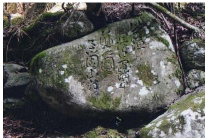
五ヶ山に残る国境石

ダムによる水没地区内にある4つの国境石は、これらと異なり五ヶ山村の村民が建てたもので、「此石垣 相障申間舗(「敷」もある)事 筑前国 五箇山村(このいしがき あいさわりもうすまじきこと ちくぜんこくごかやまむら)」と刻まれています。