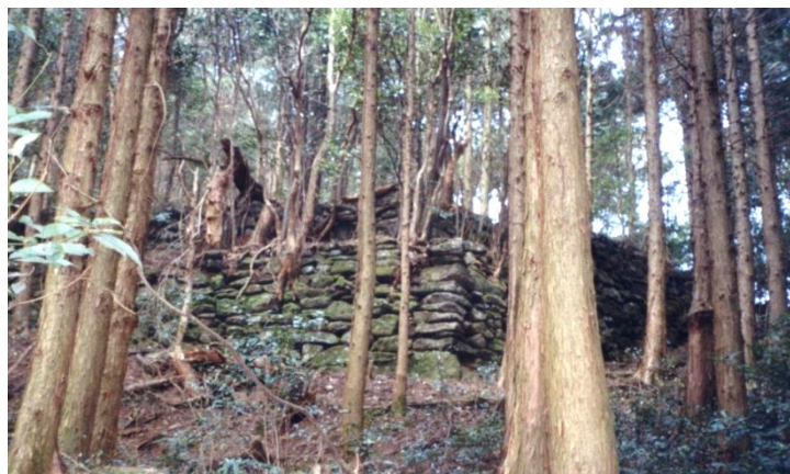
いち たけ 一の岳城跡に残る石垣

このように、五ヶ山は筑紫氏にとって筑前進出の拠点であるとともに、最後の砦でもあったのです。