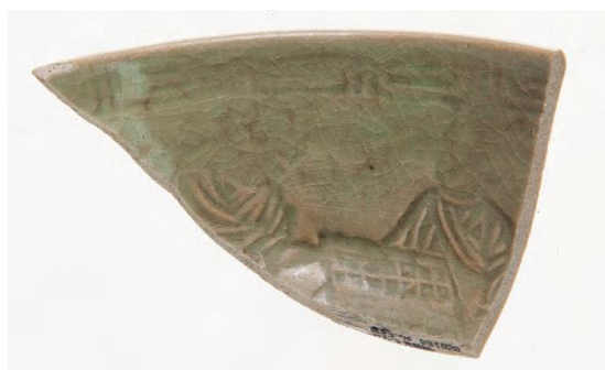
あみとり 五ヶ山網取遺跡出土人形手青磁碗

丘陵側の高台には溝で区画された室町時代の屋敷地があり、この遺跡からは高価な中国産陶磁器をもつ富裕な人物がいたようです。