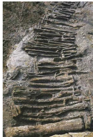
筏状遺構(奈良時代)