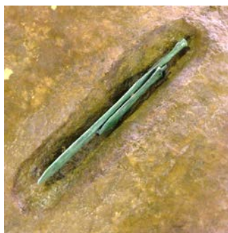
銅矛・銅戈埋納土坑(弥生時代)