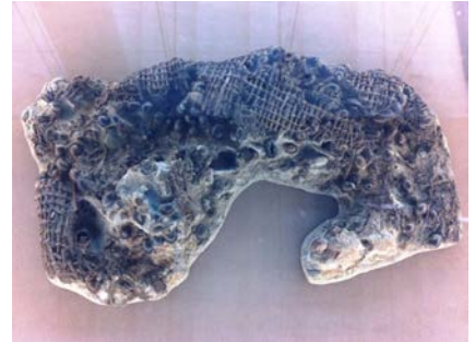
どんぐりが入ったあみ籠 (縄文時代)