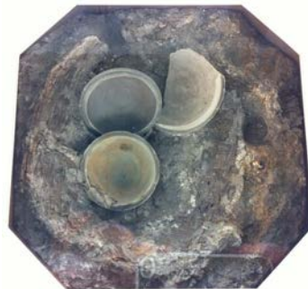
あみ籠に入った須恵器(古墳時代)