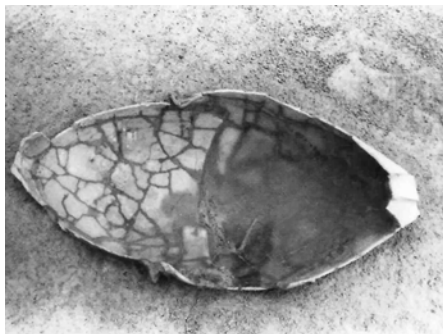
小児用甕棺墓(弥生時代)