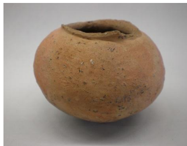
横から見た墨書のある壺

今後城門主任技師を中心に周辺出土土器を再度広げて、欠けている口縁部の破片の探索と、土器の詳細な時期の検討、墨書の類例の調査などが実施される予定だ。城門主任技師ならば、これらの課題に答えてくれること間違いなしです。是非ご期待ください。