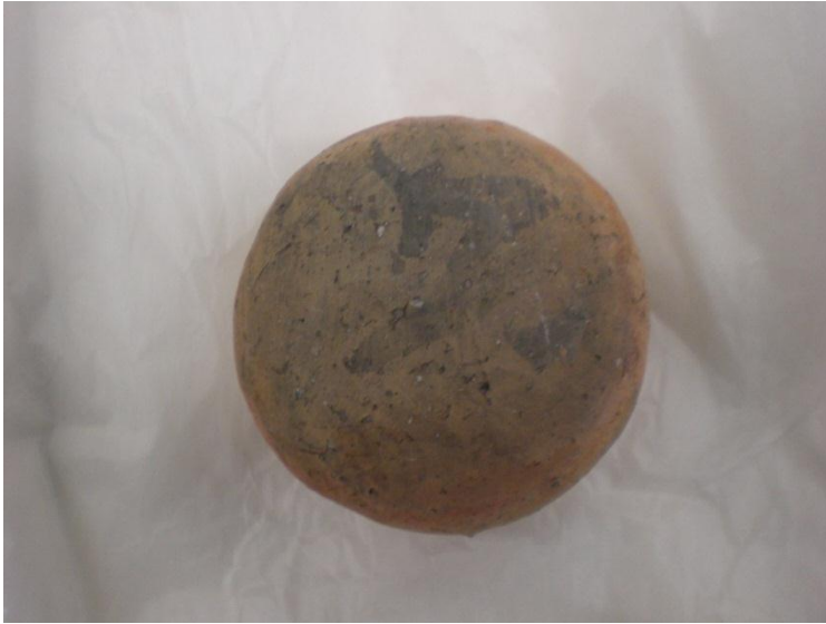
古墳時代の壺の底部に書かれた墨書