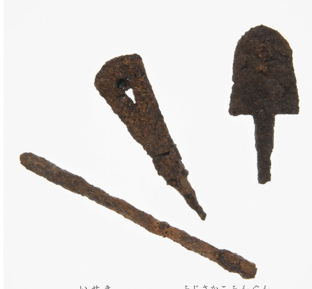
いせき 出土遺跡 筑前町 藤坂 古墳群

藤坂 I - 1 号墳の横穴式石室から出土した鉄鏃です。鉄鏃は矢の先端につける鉄製の鏃で、古墳時代後期にはいろいろな形態のものが存在します。大きく分けて、大型で鏃身幅の広い 平根鏃 と細長い 尖根鏃 の 2 種類があり、おのおの鏃身部の形から細かく分類されます。