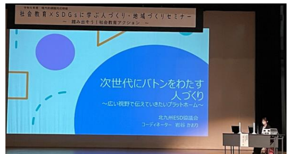
【事例発表の様子(北九州ESD協議会)】