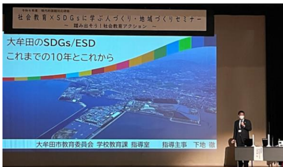
【事例発表の様子(大牟田市教育委員会)】