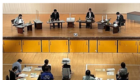
【トークセッションの様子】

本研修会は、現代的課題対応研修の新規事業として、3年計画で実施をすることになりました。初年度となる第1回は、社会教育におけるSDGs推進の機運を醸成するため、テーマを「踏み出そう!社会教育アクション」と題して開催しました。国内有数のESD先進地である北九州市と大牟田市の実践事例を基に、講師・登壇者と参加者が交流しながら、身近な地域や業務でどのようなSDGsの取組ができるかを考えてもらいました。参加者からは、「ESD・SDGsの考え方を整理することができた」「SDGsにどう社会教育に絡めるかを考えていきたい」という感想が聞かれ、地域実践に向けて意識化を図ることができました。