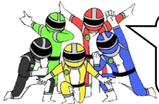
シャキョウレンジャー