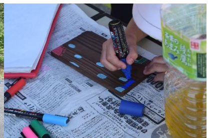
※写真はイメージです。実際の活動とは異なります。