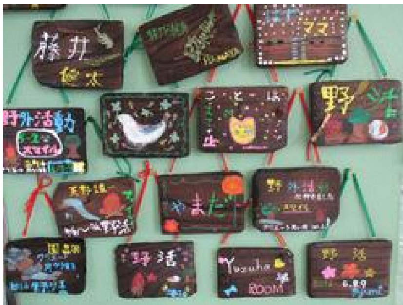
焼き杉工作 作品イメージ(例)