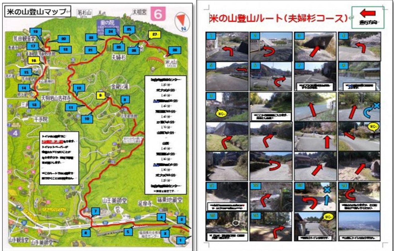
↑米の山登山マップ(表)