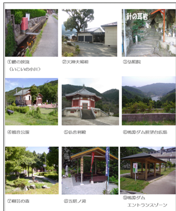
樹芸の森ハイキングマップ1(裏)