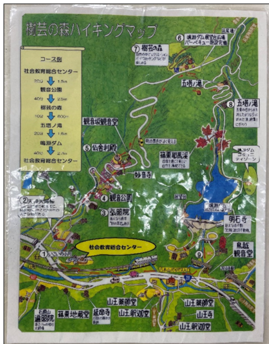
樹芸の森ハイキングマップ1