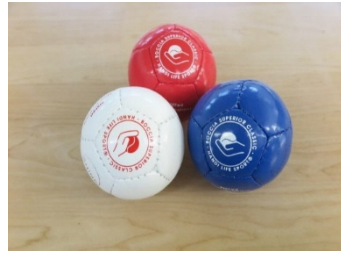
↑ ジャックボール(白)