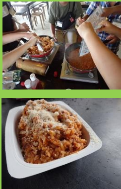
レトルト DE リゾット