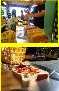
アルミ DE ホットサンド