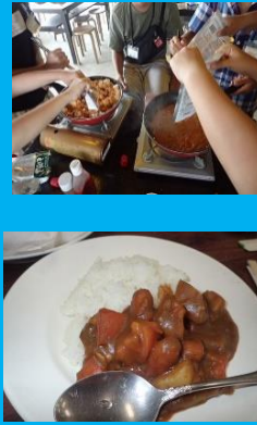
オリジナル カレー