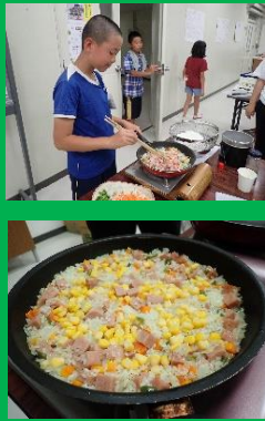
サバキャン パエリア