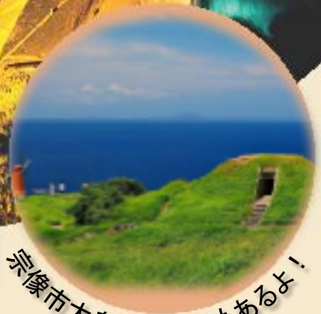
宗像市大島での活動もあるよ!