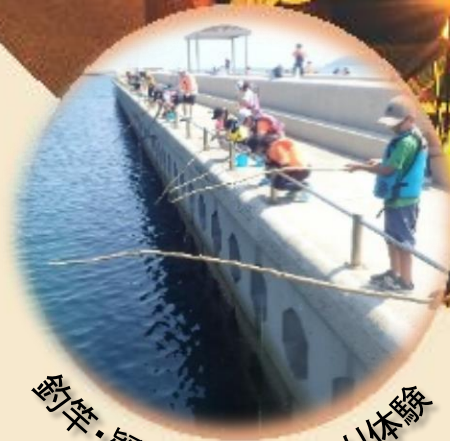
釣竿・疑似餌づくり、釣り体験

自然の中での長期宿泊体験を通じて、こどもたちのチャレンジ精神を育み、自ら考え、判断し、行動する力を育むことを目的としています