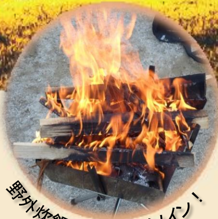
野外炊飯での食事がメイン!