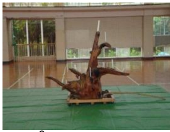
プレイホール (体育館)