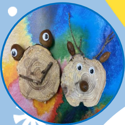
室内クラフト 木を使ったクラフト