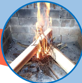
たき火 火起こし体験♪