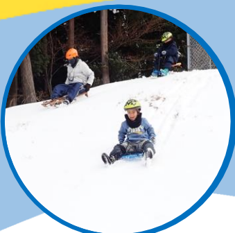
そり・かまくら 雪だるまづくり♪ 雪山散策