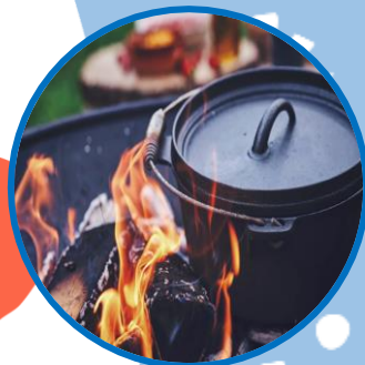
雪山クッキング♪ ※食材持込 ※一部道具貸出