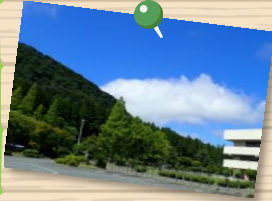
大自然を感じよう！

チームの繋がりをより良いものにするために、青年の家の職員によるレクリエーションプログラムを活用することができます。