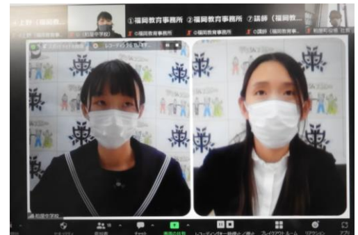
トークセッションの様子