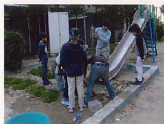
砂場のまちづくり