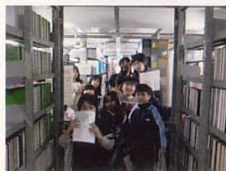
巨大な図書館を探検中!