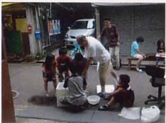
いろいろ教えてもらえるかも