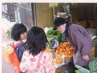
おばあちゃんに取材!